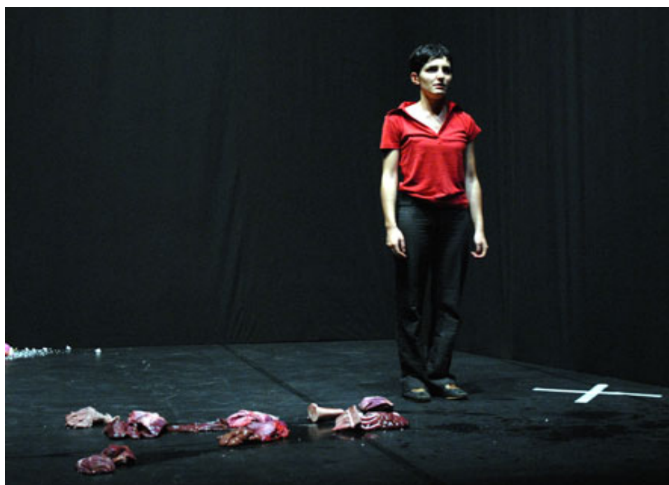
prima nazionale, In equilibrio.07 Armunia, luglio 2007