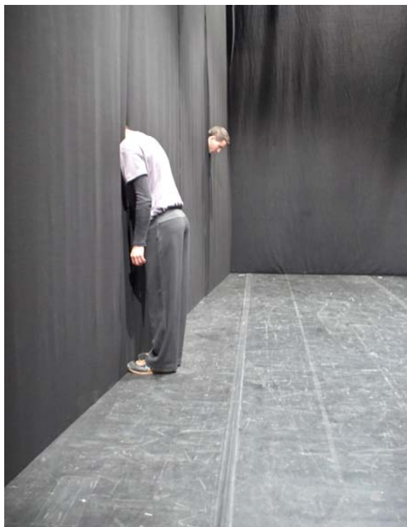
primo studio, Teatro della Limonaia marzo 2007