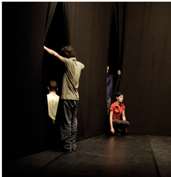
replica drodesera Centrale FIES, luglio 2007