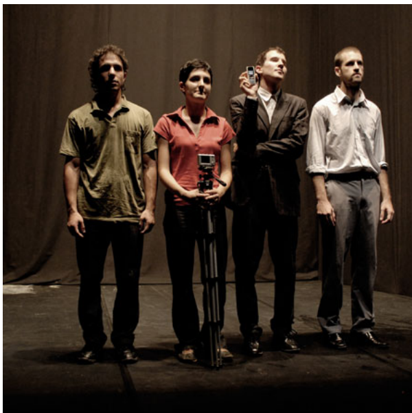
prima nazionale, Inequilibrio.07 Armunia luglio 2007