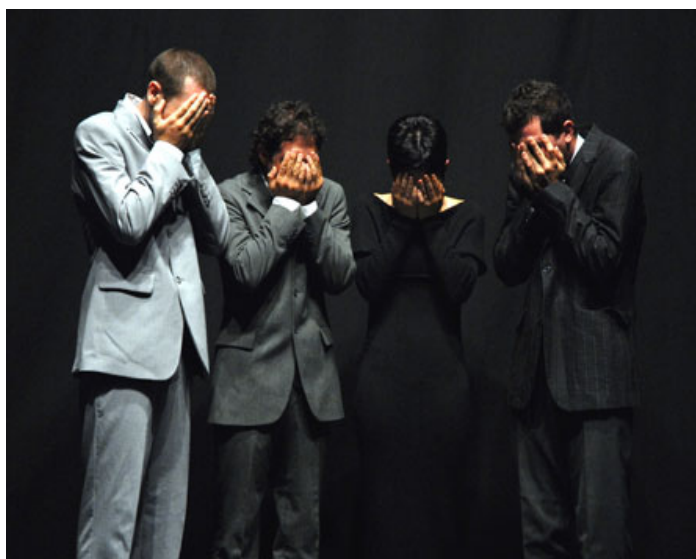
secondo studio, Prato contemporanea 07