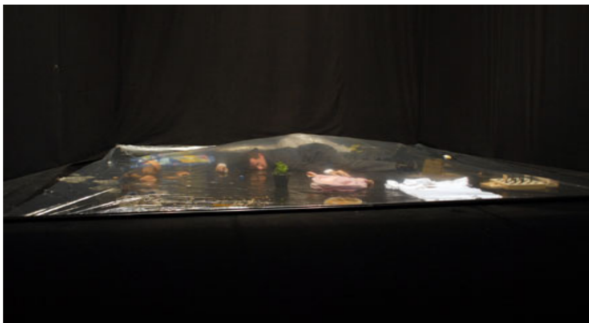
prima nazionale, Inequilibrio.07 Armunia, luglio 2007